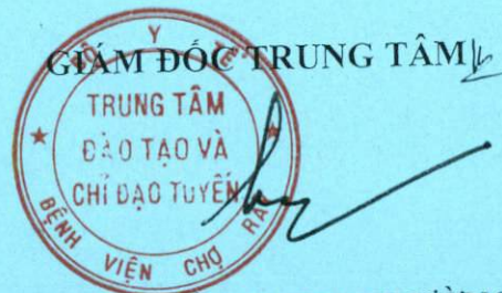
PGS.TS TRẦN MINH TRƯỜNG